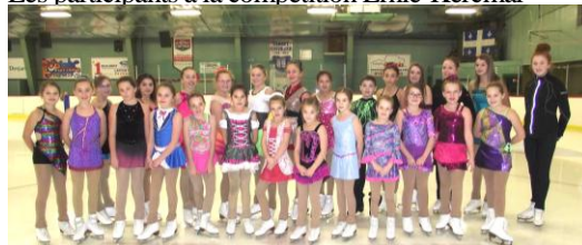
Les participants à la compétition Invitation St-Eustache