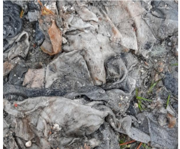
Déblocage d'égout domestique – Été 2020 (Problème : paquet de guenilles)

Suite à des problèmes d'obstruction observés par le service des travaux publics sur le réseau d'égout municipal causés par diverses matières non conformes, la Ville de Macamic désire rappeler à tous les citoyens desservis par le réseau qu'il existe des normes de rejet régies par le règlement municipal 92-366 qu'il faut respecter afin d'éviter d'obstruer l'écoulement des eaux ou de nuire au fonctionnement de chacune des parties du réseau ou de l'usine de traitement des eaux usées.