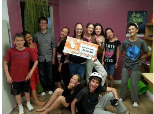
Quelques jeunes du Comité jeunesse Les Macaks de Macamic

Ces lieux de rencontre animés par des adultes signifiants ont pour but de faire en sorte que les jeunes de 12 à 17 ans deviennent des citoyens et des citoyennes actifs, critiques et responsables.