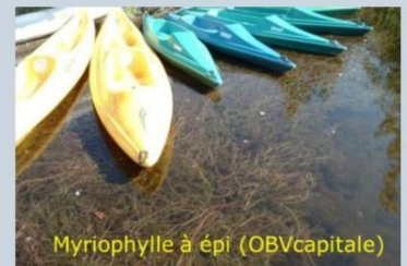
Myriophylle à épi (OBVcapitale)